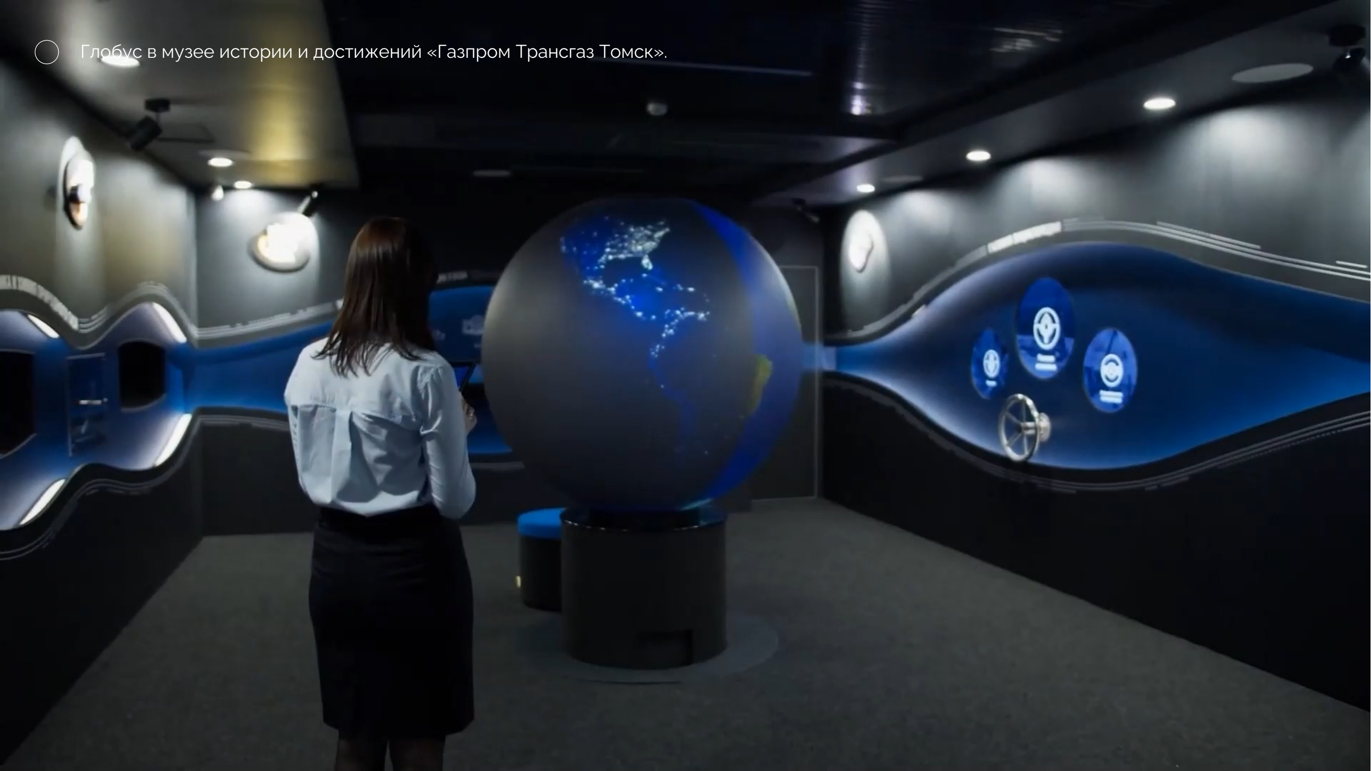
○ Глобус в музее истории и достижений «Газпром Трансгаз Томск».